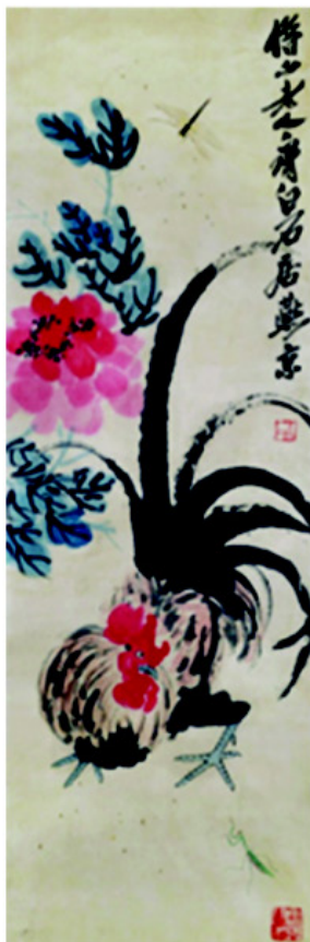
齐白石 牡丹雄鸡图