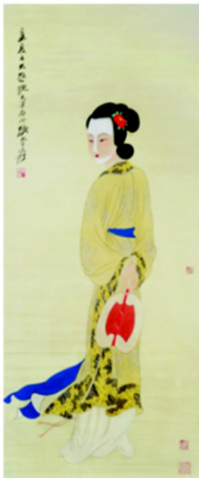
张大千 团扇仕女图