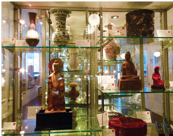
▲纽约贞观国际拍卖公司藏品。