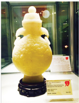
▲羊脂白玉象耳扁瓶

本季拍卖会将于9月9日（周一），美东时间下午6时开幕。预计时间为美东时间9月3日（周二）至9月8日（周日）早上10时至下午7时，9月9日（周一）早上10时至下午5时。拍卖咨询请拨打：212-867-7288 或 212-867-9388，也可发送电子邮件至 info@gianguanauctions.com。拍卖会将于曼哈顿西56街39号（五、六大道间）贞观拍卖公司举办，买家可亲临现场竞拍，亦可以登录贞观网站进行网上同步竞拍 invaluable.com&liveauctioneers.com。