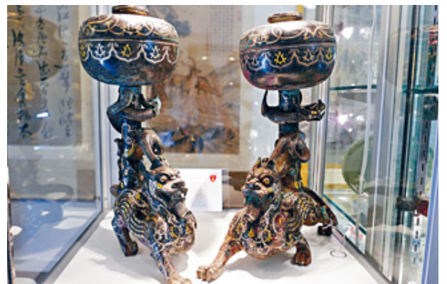
這次焦點是一對高19英寸的戰國青銅金銀錯闌邪擎螭龍柱豆。一條螭龍纏繞於柱上，並腳踩於闌邪背上，造型十分獨特。