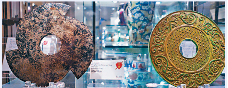
■精美的青銅刻銘紋戈，青綠色斑駁的銅鏞是年代最好的證明。