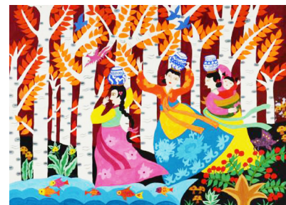
作者：文艺 作品：《白桦风情》